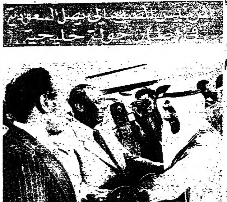
اجرى الرئيس الصومالي محمد سياد بري امس، مباحثات مع مسؤولين الصوماليين حول العلاقات المتدهورة بين بلاده واثيوبيا. وقد حمل بري الى الرياض امس الاول في اطار جولة خليجية. ويبدو اعلاؤه انه يارته الكويت مع الشيخ جابر الاحمد بن لبلاد بالقرعة.

صرح السيد بدر عبد الرحيم حيدر ادارة التجارة الخارجية بالكويت بان بلاده تعد حاليا دراسة لاقامة معرض متنقل في دول الخليج لان صادرات الكويت الى هذه الدول في زيادة مستمرة وسريعة. وقال ان الكويت سبق ان اقامت معرضا متنقلا قبل سبع سنوات في الدول الخليجية، لذلك نقرر في اقامة هذا المعرض لثانية. وقال ان المعرض الجول سيستغرق اكثر من ثمانية اشهر وذلك لان الاجراءات الروتينية لتقل المعارض من يد خارجي الى اخر تستغرق وقتا طويلا، بالإضافة الى الوقت اللازم لتقسيم وتجهيز البضائيات الخاصة بالاجنحة. وقال السيد عبد الرحيم ان حملة اعلامية ستصاحب هذا المعرض الجول بل الاعلامي والمصنعات والتحكيات على غرار الاسابيع الثقافية المرفوعة.